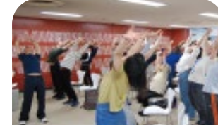
YOGA Talk & Exercise (体育・芸術図書館)

友達と一緒に課題に取り組んだり、図書館内で開催されるイベントに参加したり…。 静かに勉強するだけの場所ではありません！