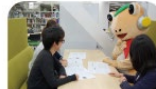
グループ学習OKの チャットフレーム(中央図書館)