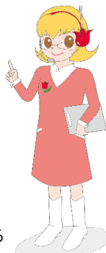
附属図書館キャラクター ちゅーりっつぶさん

友達と一緒に課題に取り組んだり、図書館内で開催されるイベントに参加したり…。 静かに勉強するだけの場所ではありません！