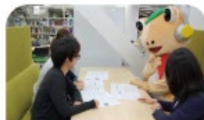
グループ学習OKのチャット フレーム(中央図書館) 2016年撮影