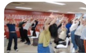
YOGA Talk & Exercise (体育・芸術図書館) 2018年撮影

友達と一緒に課題に取り組んだり、図書館内で開催されるイベントに参加したり…。 静かに勉強するだけの場所ではありません！