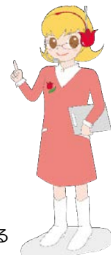
附属図書館キャラクター ちゅーりっつぶさん

友達と一緒に課題に取り組んだり、図書館内で開催されるイベントに参加したり…。 静かに勉強するだけの場所ではありません！