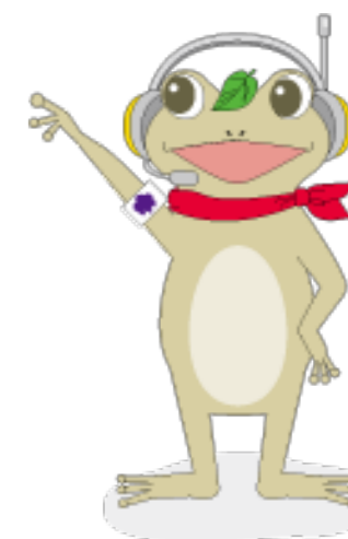
図書館公式キャラクター がまじゃんぱー