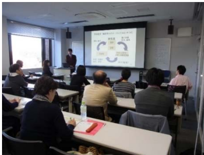
ライティング支援連続セミナー (11月15日開催、東京キャンパス)

「ライティング支援連続セミナー」の1回を大塚図書館で開催したほか、「英語論文の書き方セミナー」を医学図書館と大塚図書館で開催し、専門図書館での学習支援サービスの展開を図りました。