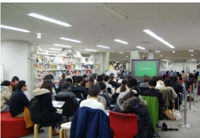
LAセミナー (1月29日開催、中央図書館)

大学院生である附属図書館ラーニング・アドバイザーの企画である「LAセミナー」を開催しました。セミナーは、授業を終えた学生が参加できるよう6時限終了後の時間の開催とし、ラーニング・スクエアの利用促進を図るため、初めて学生サポートデスク付近のオープンな学習スペースで行いました。