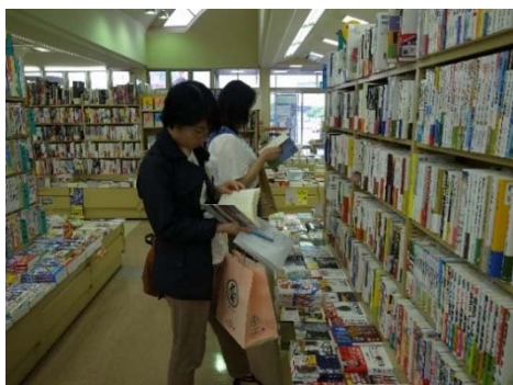
友朋堂書店桜店での選書風景

7月9日に、友朋堂書店桜店において、学生選書ツアーを開催しました。学生選書ツアーとは、学生が直接書店に出向いて図書館に置きたい本を選ぶイベントです。