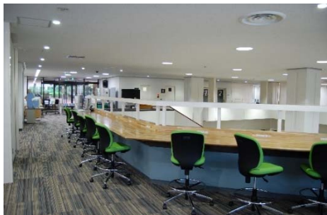
医学図書館2階吹き抜け付近に新設したカフェスタンド風の座席

耐震工事のため平成25年9月から閉館していた医学図書館は、8月6日にリニューアルオープンしました。