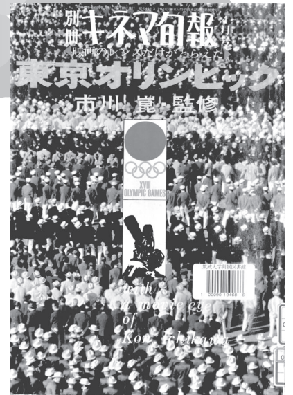
『別冊 キネマ旬報 東京オリンピック』 キネマ旬報社,1965