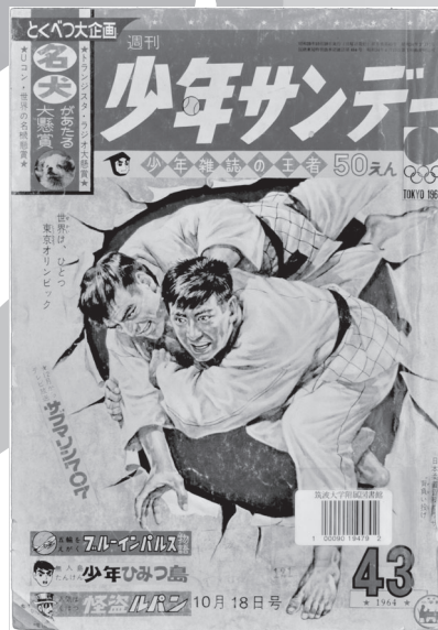
『週刊少年サンデー 10月18日号』 小学館,1964